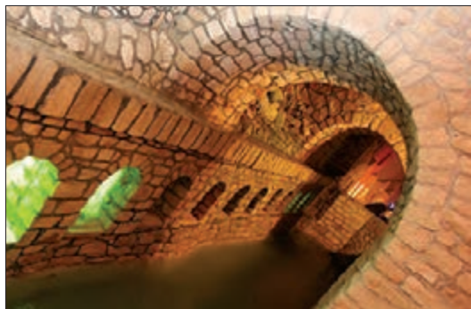
■ قنات. ابتکار ایرانیان

دانستید ورود پدیده‌های طبیعی به جهان اجتماعی باعث گسترش آن می‌شود؛ ولی جهان اجتماعی می‌تواند از این هم گسترده‌تر شود. آیا می‌دانید چگونه؟ شناخت خداوند، فرشتگان و جهان ماوراءطبیعی، آرمان‌ها و ارزش‌های زندگی آدمیان را تغییر می‌دهد و کنش‌های اجتماعی آنان را دگرگون می‌سازد.