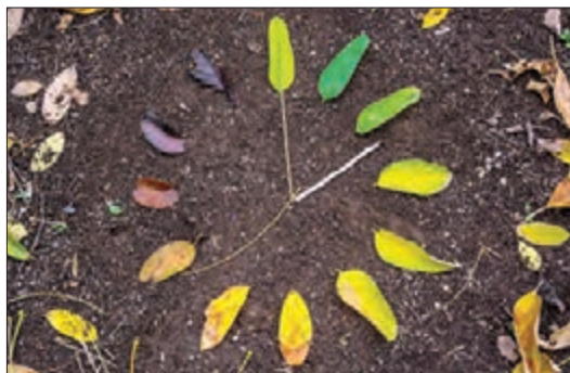
■ ورود پدیده‌های طبیعی و ماوراءطبیعی به جهان اجتماعی