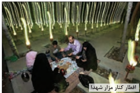
افطار کنار مزار شهدا

روزی ابوعلی سینا در خانه‌اش نشسته بود و یکی از کتاب‌های افلاطون دانشمند یونان باستان را با لذت می‌خواند. او چند سال به دنبال این کتاب گشته بود تا سرانجام آن را به دست آورده بود و عجله داشت تا هرچه زودتر آن را مطالعه کند. هرچه بیشتر می‌خواند لذت بیشتری می‌برد و کنجکاوی او برای خواندن مابقی کتاب بیشتر می‌شد. ناگهان در خانه باز شد و یکی از همسایگان وی قدم در خانه گذاشت و با دیدن ابوعلی سینا پرسید: همسایه عزیز چرا تنها نشسته‌ای؟ ابوعلی سینا که رشته افکارش پاره شده بود آهی کشید و گفت: تنها نبودم، الان تنها شدم!