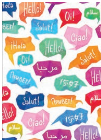
■ زبان و پوشش؛ پدیده‌های اجتماعی

بانک، مسجد، پلیس، مدرسه، خانواده، گروه دوستان، نمادها، هنجارها، ارزش‌های اجتماعی و... نمونه‌هایی از پدیده‌های اجتماعی هستند که در سال گذشته با برخی از آنها آشنا شدید. به کنش اجتماعی و پیامدهای آن «پدیده اجتماعی» می‌گویند. کنش اجتماعی خردترین (کوچک‌ترین) پدیده اجتماعی است و سایر پدیده‌های اجتماعی، آثار و پیامدهای آن می‌باشند. مثلاً فردی به تنهایی و با صدای دلخواه در مکانی مطالعه می‌کند. حال اگر فرد دیگری وارد شود، مطالعه او به یک کنش اجتماعی تبدیل می‌شود و پای ارزش‌ها و هنجارهای اجتماعی را به میان می‌آورد. او برای رعایت حقوق دیگری (تحقق یک ارزش) باید در حضور دیگران، آرام مطالعه کند (پیدایش یک هنجار). هنجار اجتماعی، شیوه انجام کنش اجتماعی است که مورد قبول افراد جامعه قرار گرفته است. مثلاً در هر جامعه‌ای احوالپرسی از دیگران، شیوه‌های معینی دارد. ارزش‌های اجتماعی، آن دسته از پدیده‌های مطلوب و خواستنی‌اند که مورد توجه و پذیرش هستند و افراد یک جامعه نسبت به آنها گرایش و تمایل دارند. اگر کنش اجتماعی نباشد، هیچ هنجاری شکل نمی‌گیرد و هیچ یک از ارزش‌های اجتماعی مانند عدالت، امنیت و آزادی محقق نمی‌شوند. ارزش‌ها از جنس هدف و مقصود هستند و هنجارها از جنس وسیله و روش رسیدن به ارزش‌ها هستند.