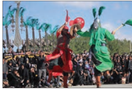
■ آگاهی‌های مشترک و تداوم آنها

جهان اجتماعی با انتقال فرهنگ خود به نسل‌های بعد تداوم می‌یابد. فرهنگ از طریق وراثت از نسلی به نسل دیگر منتقل نمی‌شود. به نظر شما فرهنگ با چه روشی از نسلی به نسل دیگر انتقال می‌یابد؟