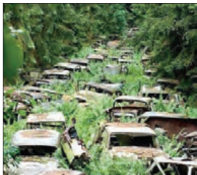
■ اقدامات شتاب‌زدهٔ انسان در مواجهه با طبیعت