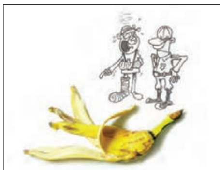
■ پیامدهای کنش