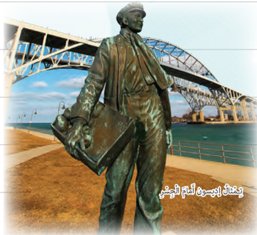
يَعْبُدُ إديسون أُلَمَ الْبَشَرِ

فَطَرَدَهُ مُدِيرُ مَدْرَسَتِهِ مِنَ الْمَدْرَسَةِ وَقَالَ عَنْهُ: «إِنَّهُ تَلْمِيذٌ أَحْمَقٌ.»