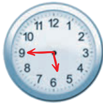
السَّادِسَةُ إِلَّا رُبْعًا